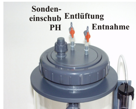
Sonden- einschub PH Entlüftung Entnahme